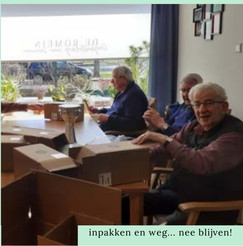
inpakken en weg... nee blijven!