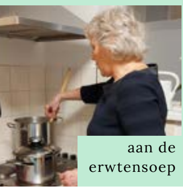
aan de erwtensoep