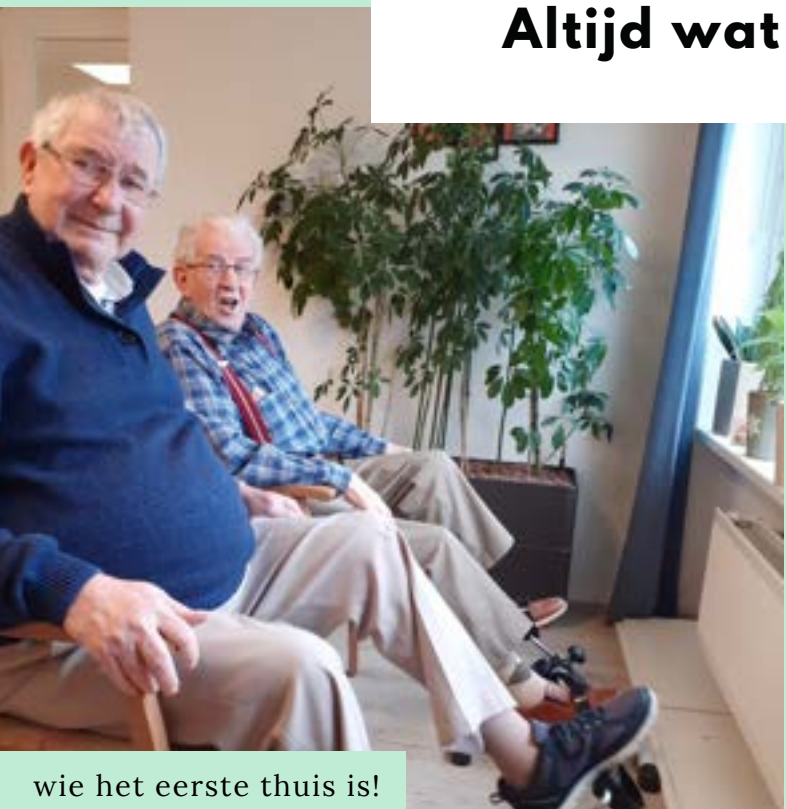
wie het eerste thuis is!