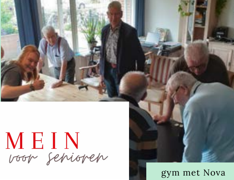
gym met Nova