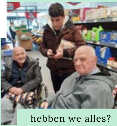
hebben we alles?